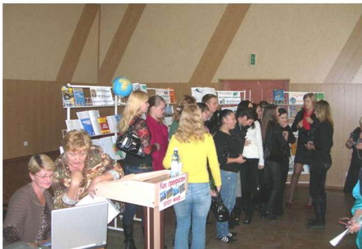
Обмен мнениями после мероприятия